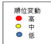
2014 年 1 月～6 月